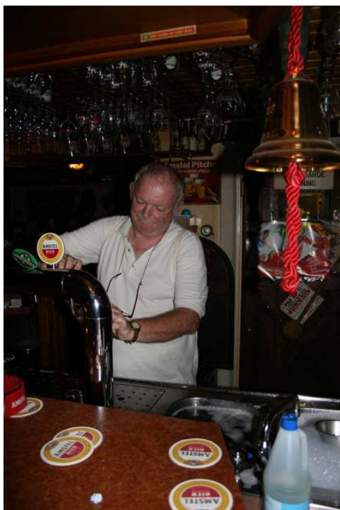
Het winnende tapje komt ter wereld

vroeg of dat bier soms voor hem was. En ja, dat was het. Hij liep blij met zijn prooi naar zijn maten.